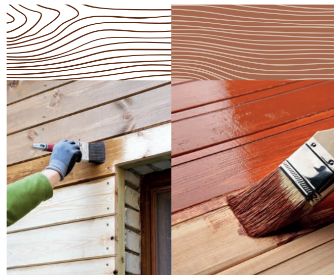
SO'CLEAR ACRYL GLYCÉRO

Elles permettent de préserver l'aspect naturel du bois tout en le protégeant efficacement. Acrylique, glycéro ou opaque, il existe plusieurs types de lasures pour vos boiseries. La lasure opaque vous offre un plus grand choix de couleurs en matière de décoration.