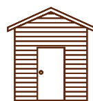
Abris de jardin, bardages, lambris, boiseries