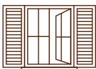
Volets, portes, fenêtres

SO'WOOD vous propose une gamme complète pour la protection et la décoration des bois et vous offre la finition adaptée à vos besoins.